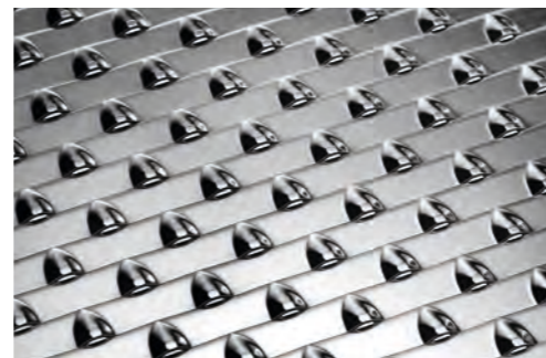
CONIDUR® – das Lochblech von HEIN, LEHMANN